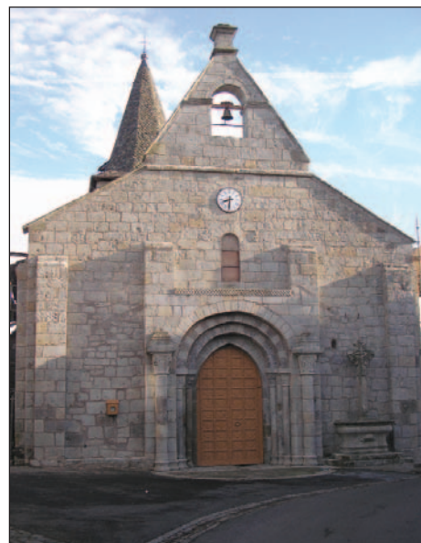
Façade ouest restaurée sans les statues