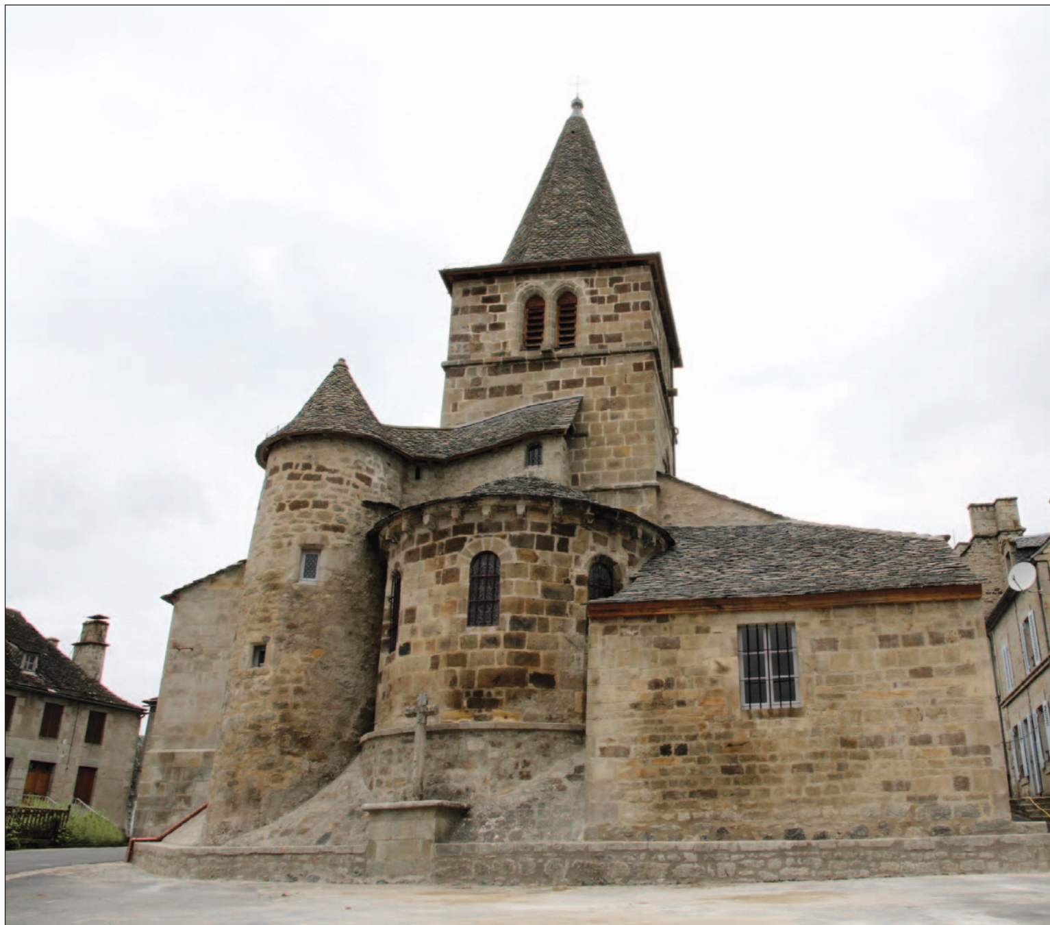
L'église Saint-Martin de Menet, restaurée, vue de l'abside

Quatre chapelles furent construites par la suite, ainsi qu'une tourelle d'escalier, un clocher et le pignon du portail. Deux de ces chapelles datent de la Renaissance. L'une appartenait à la famille de Chabannes, qui entre autres possessions dans le Nord-Cantal, disposaient des droits de seigneurie sur le château de La Clidelle. L'église fut classée Monument historique le 1 er septembre 1922.