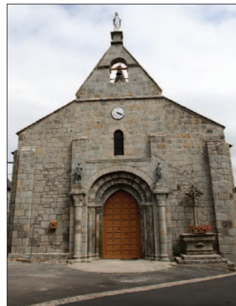
Façade ouest aujourd'hui