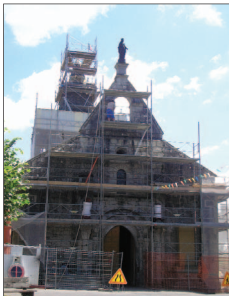
Façade ouest en cours de travaux