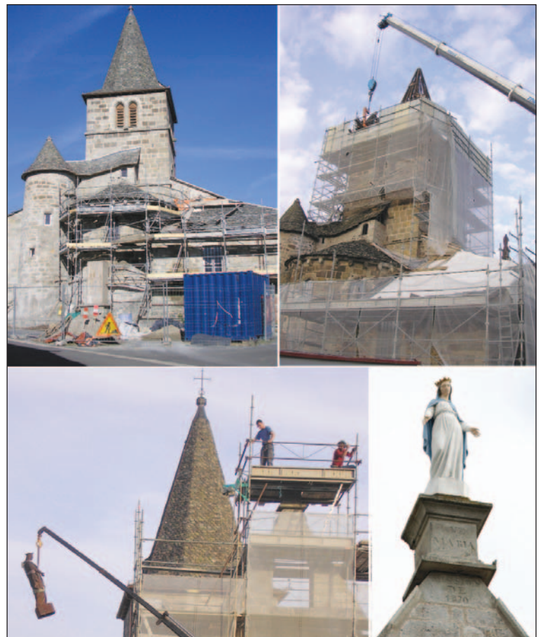
En haut, montage des échafaudages. En bas, la Vierge (dépose et mise en place).