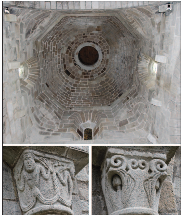
En haut, la voûte en coupole au-dessus du chœur de l'église. En bas à gauche et à droite chapiteaux sculptés de la façade ouest.

Commencés en avril 2009, les travaux sont en voie d'achèvement en ce mois de juin 2011. Les façades et les toitures ont fait l'objet d'importants travaux de restauration. Les travaux ont été inscrits dans le plan de relance gouvernemental. L'obligation pour la commune d'être maître d'ouvrage a alourdi et compliqué la tâche, la commune ne possédant pas tous les moyens techniques nécessaires. Mais malgré ces difficultés, le chantier a été mené à bien avec