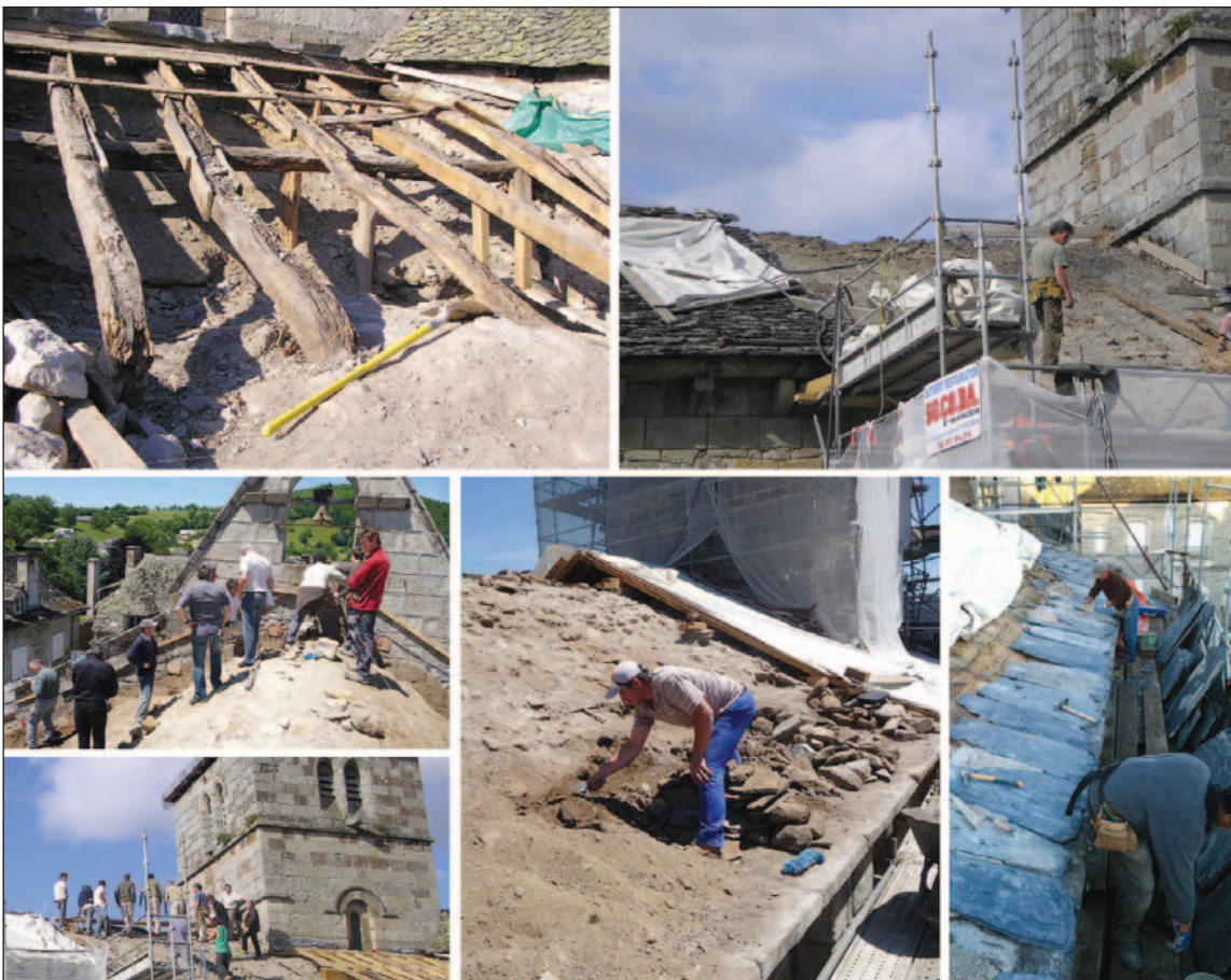
Restauration de la toiture à différentes phases, ainsi que visite de chantier sur le toit de l'église.

Ne pas manquer également, Les Rencontres européennes , du 1 er au 15 juillet 2011.